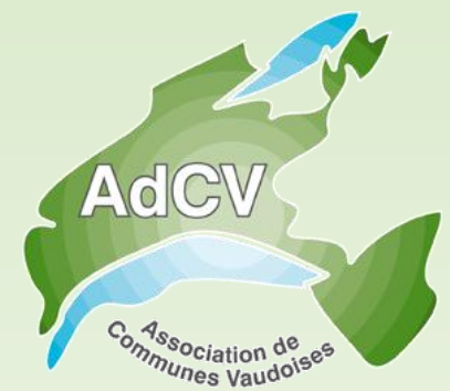
Plate-forme financière Revendications